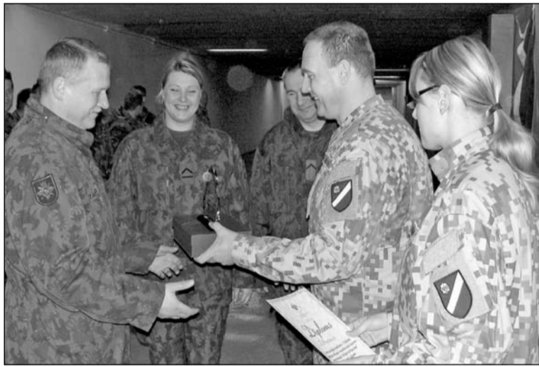
Apdovanojama Lietuvos komanda.

Kaip ir dera, nugalėjo šeiminingai – Latvijos komanda, surinkusi 548 taškus, II vietą iškovojo lietuviai – 495 taškai, III – estai (484 taškai), toliai – Ispanija, Olandija, Lenkija, Didžioji Britanija, Austrija ir Italija.