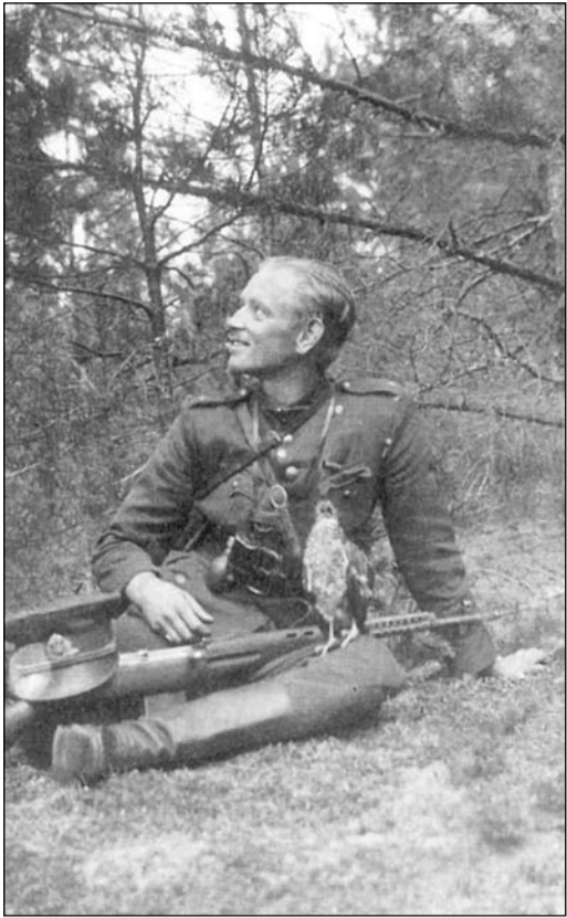
Adolfas Ramanauskas-Vanagas 1947 m. vasarą.