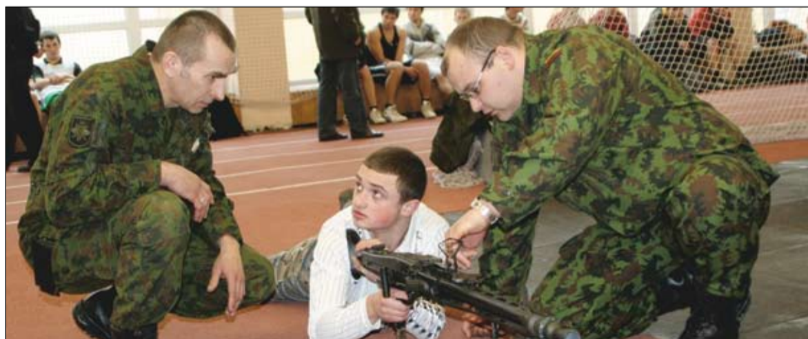
Pirmoji pažintis su ginklais.

do skirtingas užduotis, tačiau jų darbas ir tikslai – bendri. Šįkart savanoriai buvo KPAT „palaikymo grupė“: atsivežti ginklai traukė jaunimo akį, tad daugelis neatsispausdavo pagundai pajusti „Karlo Gustavo“ svorį ant savo peties ar pačiupinėti kulkosvaidį. Tuo tarpu KPAT atstovai aiškino jauniems sportininkams apie galimybes tapti profesionaliais kariais, o šauliai surengė šaudymo varžybas.