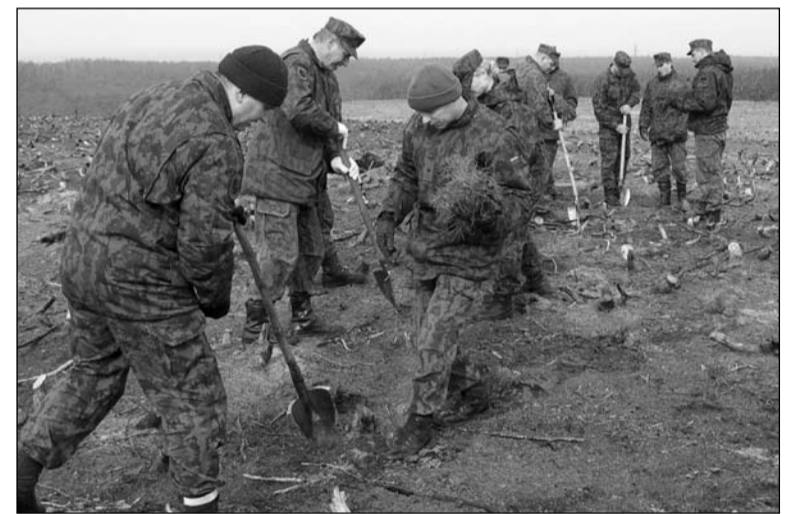
Dragūnai Smiltynėje sodina mišką.

Tris dienas nuo ryto iki vakaro Butigeidžio dragūnų mokojo bataliono kariai į smėlėtą ir sudegusių medžių šaknimis apraizgytą dirvožemį sodino pušų sodinukus. Metras po metro ir daugiau kaip 10000 pušų sodinukų, pasodinti trijų hektarų plote. Miškininkai sako, kad tik kas dešimtas sodinukas išgyvens, bet kariai labai stengėsi ir tiki, kad jų pasodintos pušelės tikrai prisigis.