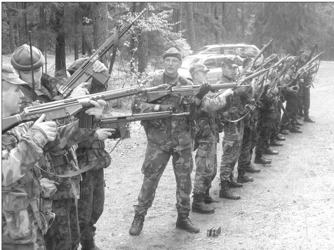
Pratybos baigėsi: „Ginklus apžiūrai!“

Kai iš mokymų grįžtame atgal į kuopą, išsivalome ginklus, juos grąžiname į ginklinę, nusišveičiame batus ir keliaujame namo.