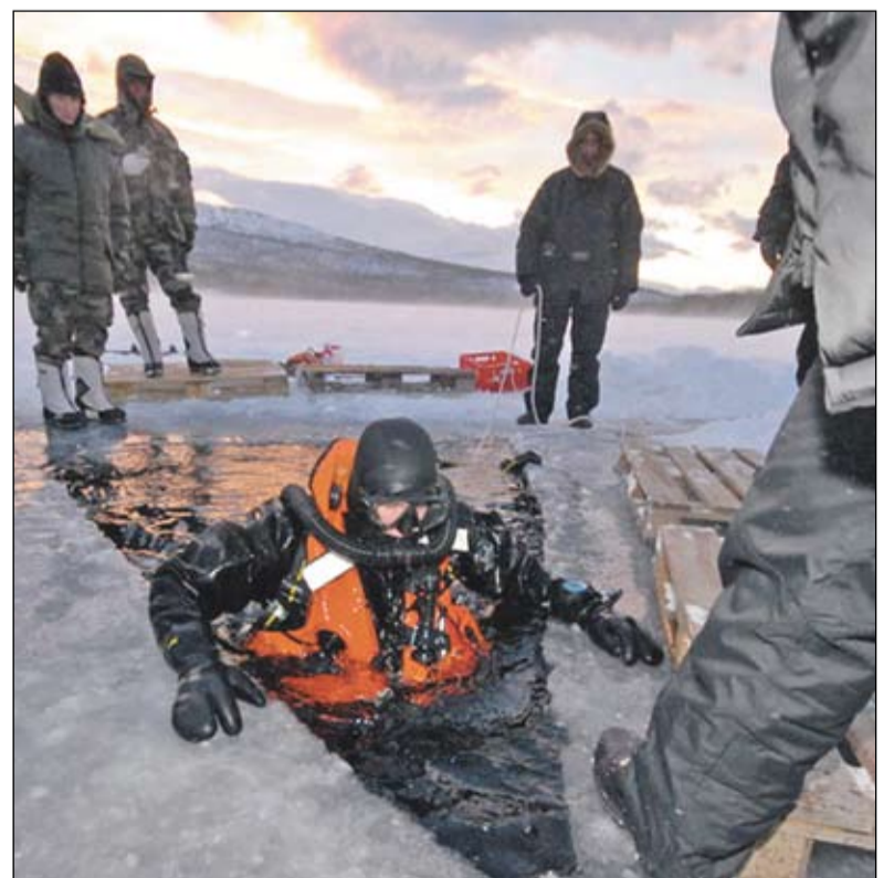
Naro išminuotojo parengimas trunka dvejus metus.