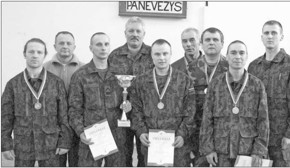
Kariuomenės čempionė – Vyčio rinktinės komanda su rinktinės vadu plk. lt. Ričardu Leikumi.