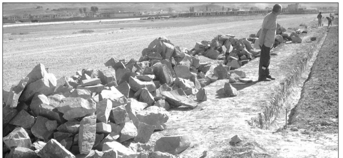
Taip dirbama statybose Afganistane.

– Palapinė, stalas, kompiuteris, „Tojotos“, keliai, kalnai, laukai, žmonės. Kartais sunku, kartais linksma, kartais tiesiog neįmanoma dirbti, tačiau nepasakyčiau, kad Lietuvoje ir turint idealias, palyginti su čionykštėmis, darbo sąlygas, kitaip. Tiesiog reikia užsibrėžti sau aiškius tikslus, susi-