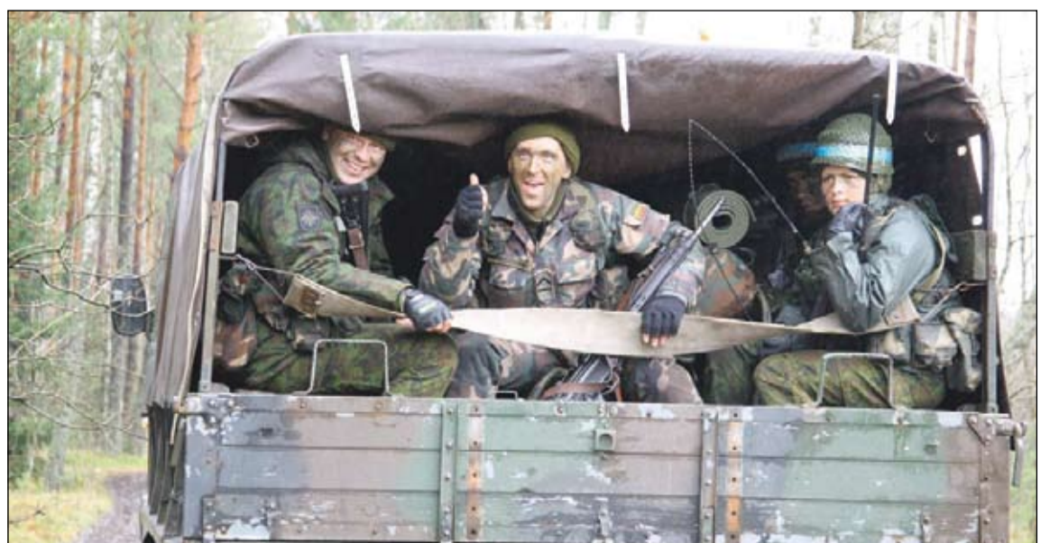
Pratybos baigtos, važiuojam namo...