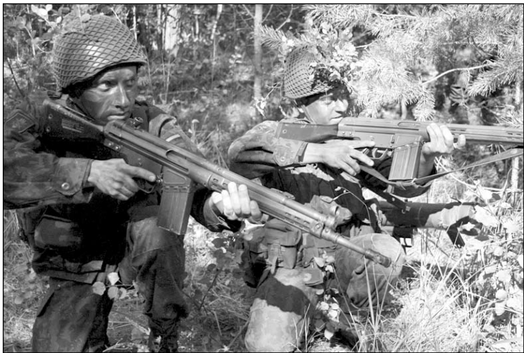
Kariai septynių parų pratybose.

tinantis laikytis kariškos tvarkos ir drausmės. Antra vertus, turime ir sąlygas: savanorius apgyvendiname buvusiam mokymo centre, čia yra auditorijos teoriniams užsiėmimams, o šalia – Birutės bataliono poligonas. Maistą gamina bataliono virtuvė (valgykla šiuo metu remontuojama). Dar svarbu, kad galime suformuoti visavertę mokomąją kuopą, panaudoti visus ginklus, tuo tarpu atskirų kuopų ar būrių pratybose tai kulkosvaidininko nėra, tai, žiūrėk, granatsvaidininkas prašepės, negali dalyvauti... Septynių dienų pratybas ketiname rengti ir ateityje, nes jos, mūsų įsitikinimu, pasiteisina ir yra naudingos.