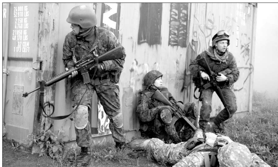
Baigiamasis mokymų etapas – lauko pratybos.