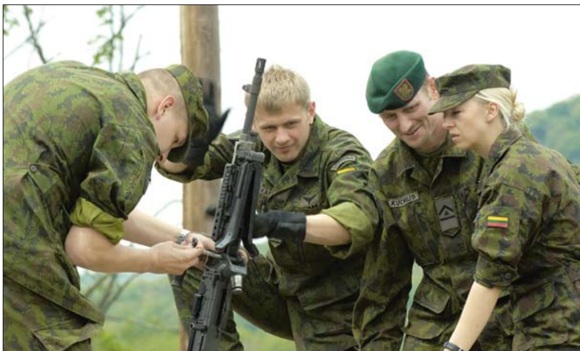
Kurse kartu su vyrais dalyvavusios merginos amerikiečių instruktorius nustebino savo aktyviu dalyvavimu viose pratybose.