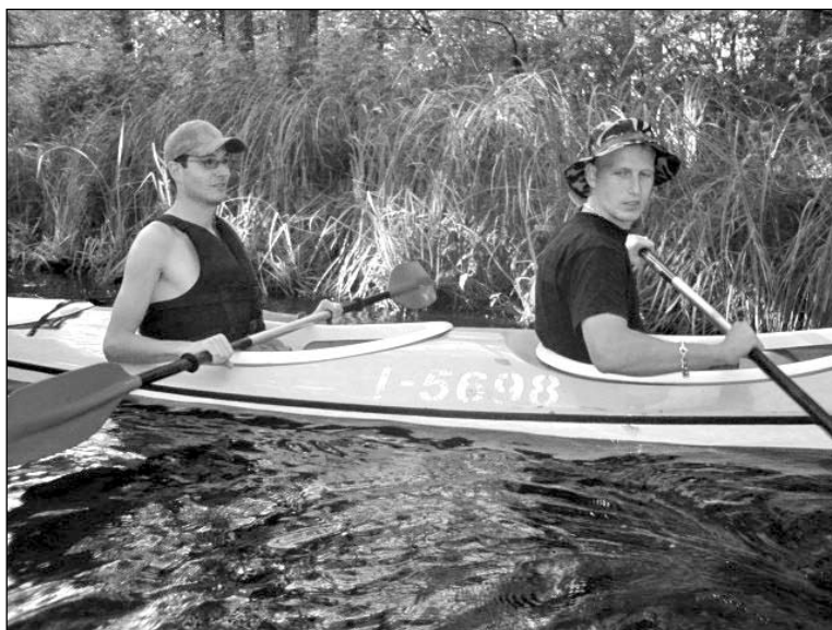
CKB kuopos savanoriai žygyje – Aukštaitijos nacionaliniame parke.

vanoriais, tarnaujančiais kuopoje ir ypač vasaros laikotarpiu, kai nėra pratybų. Stengdamiesi šią savo užduotį įvykdyti, mes klausėme karių, kaip jie įsivaizduoja neformalų bendravimą šią vasa-