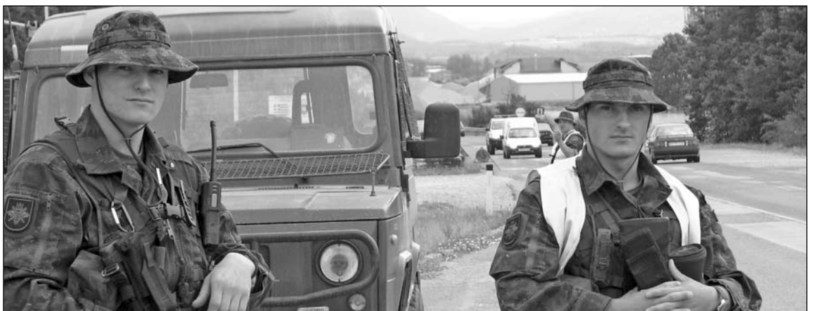
KFOR-18 būrio taikdariai patrulyje.

Jau visiškai tamsu, tik bazė švyti visomis šviesomis. Vartai atsiveria, tikrinami ginklai, identifikavimo kortelės. Patruliavimas baigtas.