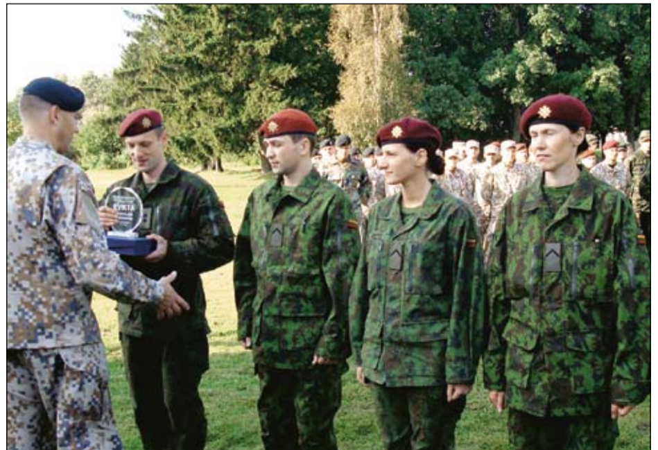
Mūsų mišri komanda užėmė II vietą.