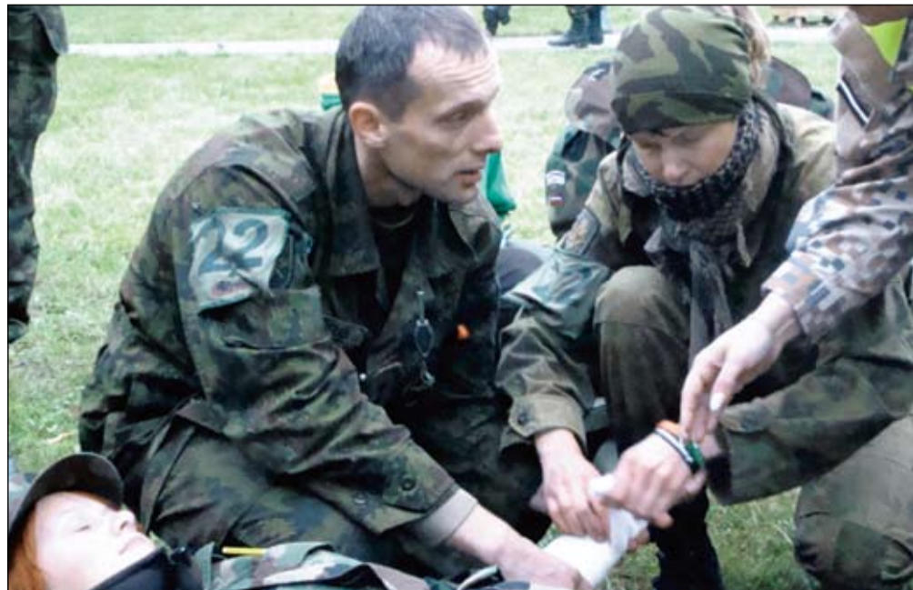
Pirmoji medicinos pagalba.