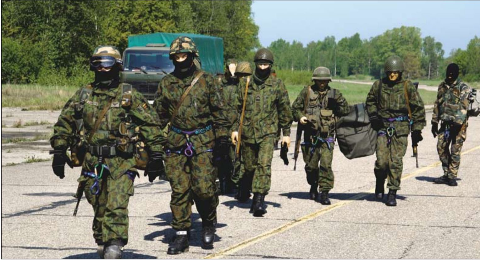
Vyčio rinktinės žvalgai.