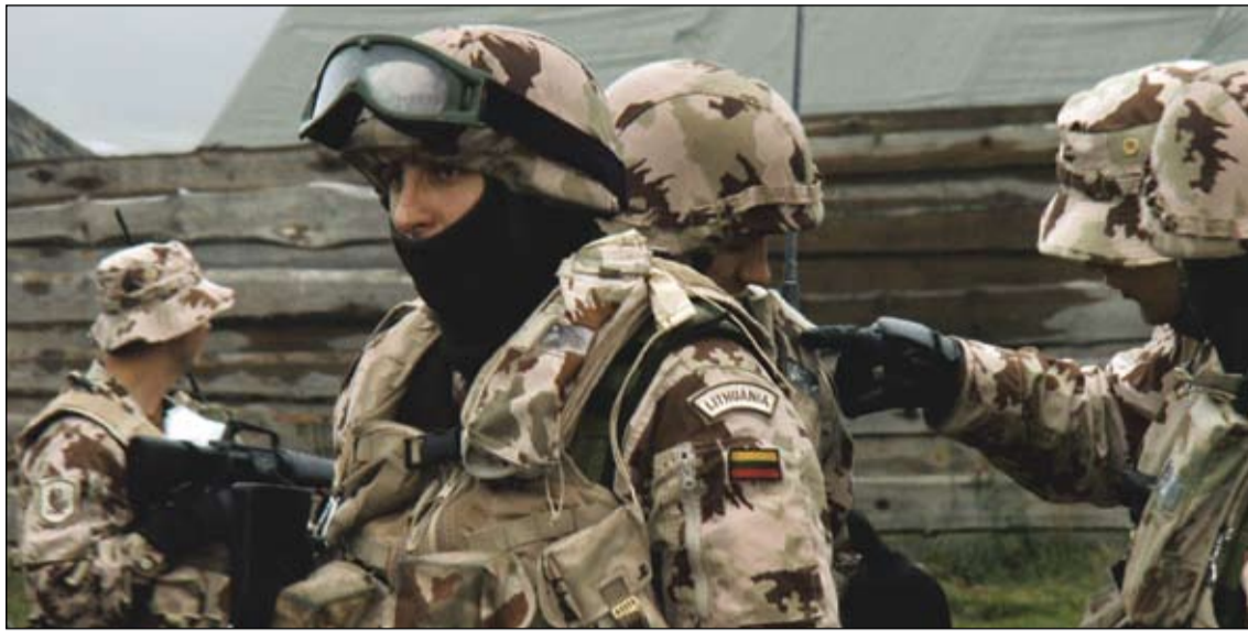
Štabo kuopos kariai...

Pratybose spalio 13–17 dienomis, vykusiose Kairių poligone, situacijos buvo panašios, netgi tęstinės, perkeltos iš teorinių pratybų Nemenčinėje, tačiau visas veiksmas vyko tikrovėje, ne simulatoriaus ekrane ar žemėlapiuose. Jei štabo pratybose Nemenčinėje veiksmas vyko kompiuterių monitoriuose, tai čia kariai visureigiais važinėdavo į tolimus patrulius, aprėpusius visą Klaipėdos apskritį, o už stovyklos vartų siautėdavo pakankamai agresyvūs „riaušinininkai“, smagios buvo ir „pėstininkų“ oro sąlygos, kartais palepindavusios pra-