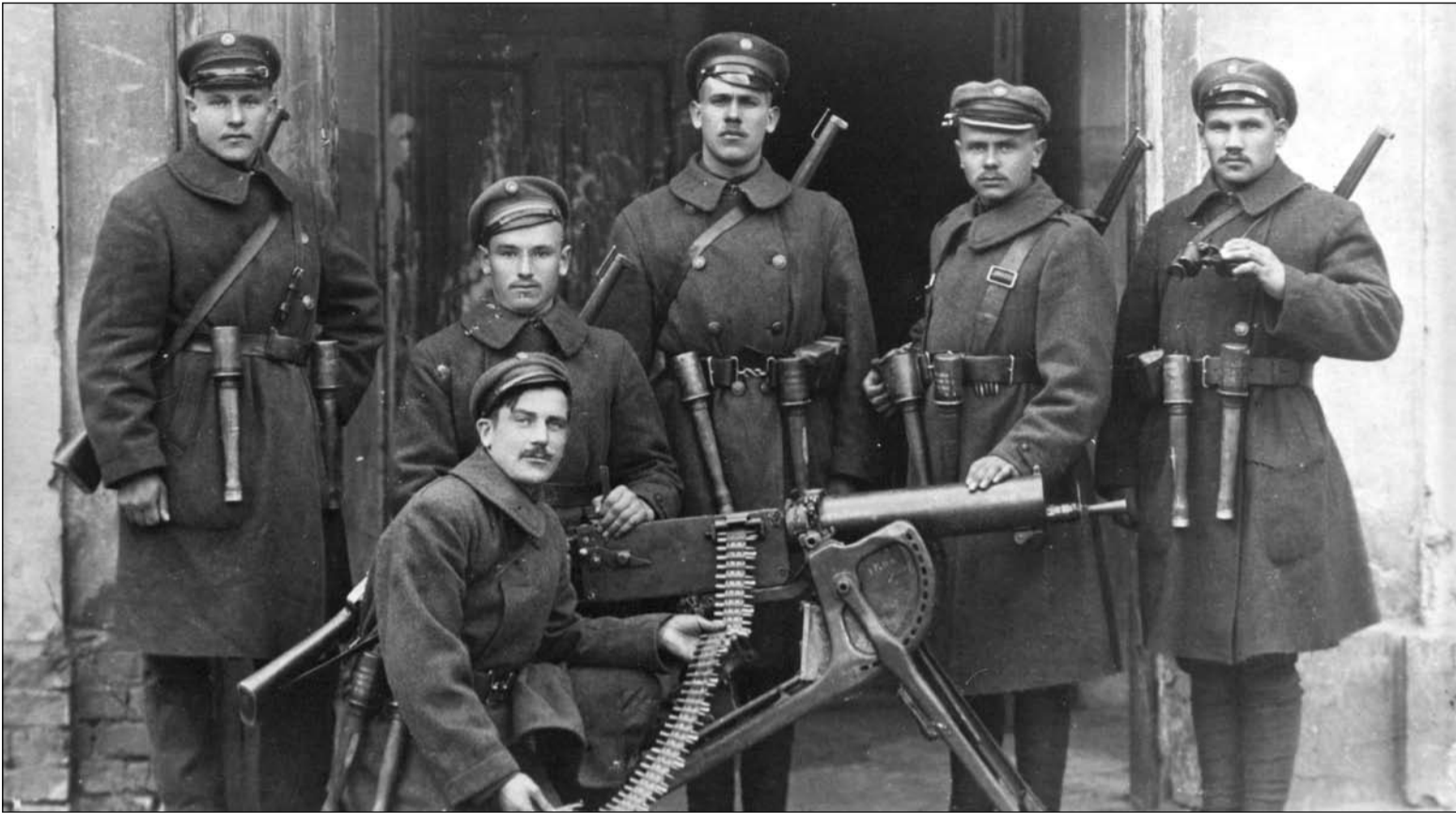
1920 m., sulaužę taikos sutartį, lenkai vėl užpuolė Lietuvą. 9-ojo pulko kariai pasirengę vykti į frontą.