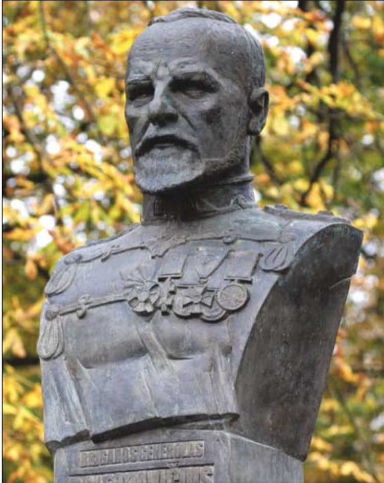
Gen. Povilo Plechavičiaus biustas Karo muziejaus sodelyje.

1926 m. į valdžią atėjus kairiesiems Plechavičius vadovavo gruodžio 17-osios perversmui, tačiau pats į valdžią nesiveržė. Perversmas, kad ir kaip jį bevertintum, aplaužė ragus komunistams, pristabdė destruktivią kairiųjų ir klerikalinių grupių veiklą. Tauta jį vertino teigiamai. Vaižgantas taip sakė: „Gėda tai gėda, bet ir gerai, kad tokią netikusią valdžią nuvertė“, nes jau iki gyvo kaulo visiems buvo įgrisusios partijų rietenos, drabstymasis purvais, postų skirstymas ne pagal kompetenciją, bet pagal partinių plunksnų spalvas. Dar romėnų istorikas Titas Livijus taikliai pastebėjo: „Partijų tarpusavio kova yra ir visada bus daug didesnė bėda tautai negu karas, badas, maras ar bet koks kitoks dievų pyktis.“ Antroji Plechavičiaus nuodėmė, ku-