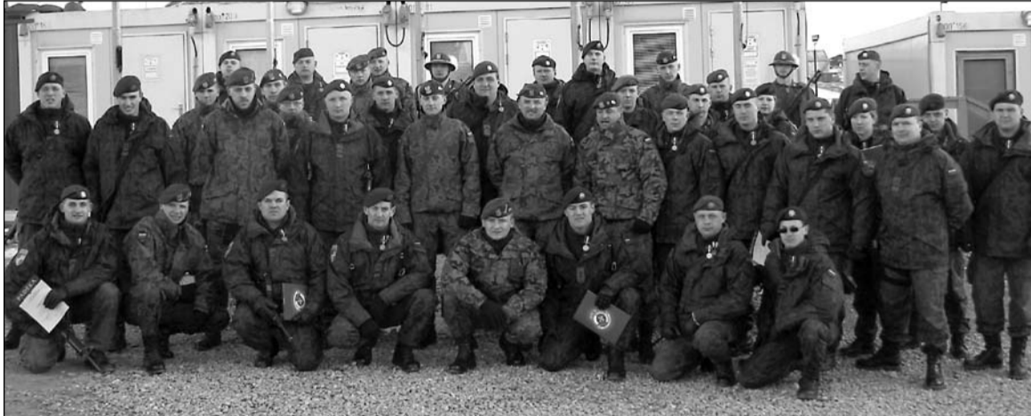
KFOR-17 būrio kariai su kolegomis lenkais po apdovanojimų ceremonijos Vasario 16-ąją.

O mes ir didžiuojamės, kad esame lietuviai.