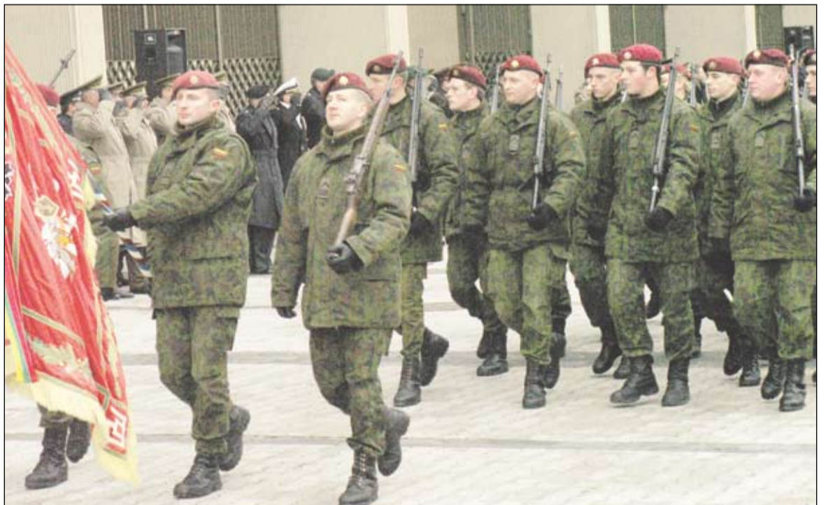
Alytaus savanoriai prie Seimo rūmų.