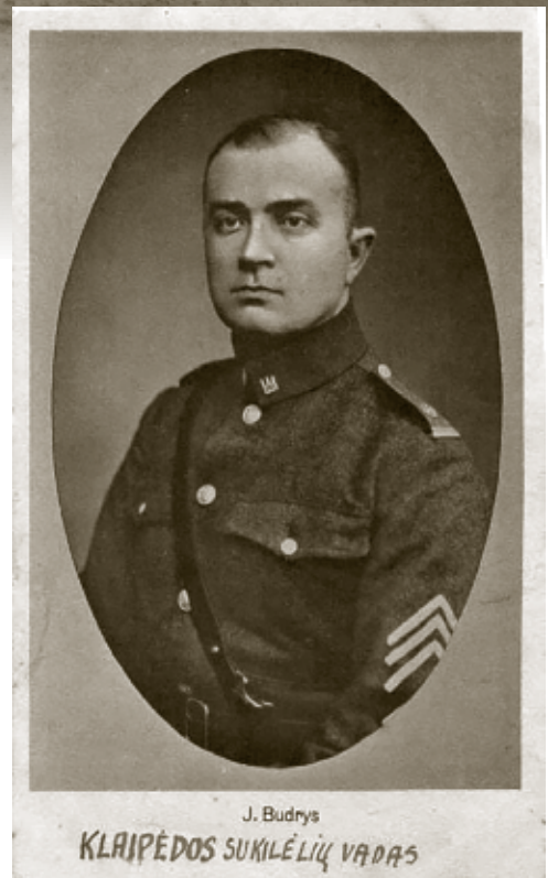
J. Budrys KLAIPĖDOS SUKILĖLIŲ VADAS

Siekdamas apginti Lietuvos interesus, Galvanauskas šios idėjos įgyvendinimo siekė diplomatijos keliu. Jis įsitikino, kad Veimaro vyriausybė pirmenybę teikia Klaipėdos patekimui į Lietuvos rankas, nes Lietuvą laikė neutralia, o Prancūziją ir Lenkiją, kurioms šią teritoriją galėjo atiduoti Tautų Sąjunga, – didžiausiomis priešėmis. Vėliau paaiškėjo, kad Berlynas sukilimo metu palaikė neoficialius ryšius su lietuviais ir ragino vietos vokiečius netrukdyti akcijai. Sovietų rusai, kurie priešinosi didesnei Lenkijos valstybei, ne tik palaikė šią akciją, bet ir būtų įsikišę, jei Lenkija imtųsi veiksmų prieš Lietuvą. Nors ir keista, Lenkijos vyriausybė taip pat mieliau būtų mačiusi Klaipėdą Lietuvos rankose ne taip, kaip Dancigą, tapusį laisvu miestu ir patekusį į Vokietijos įtaką.