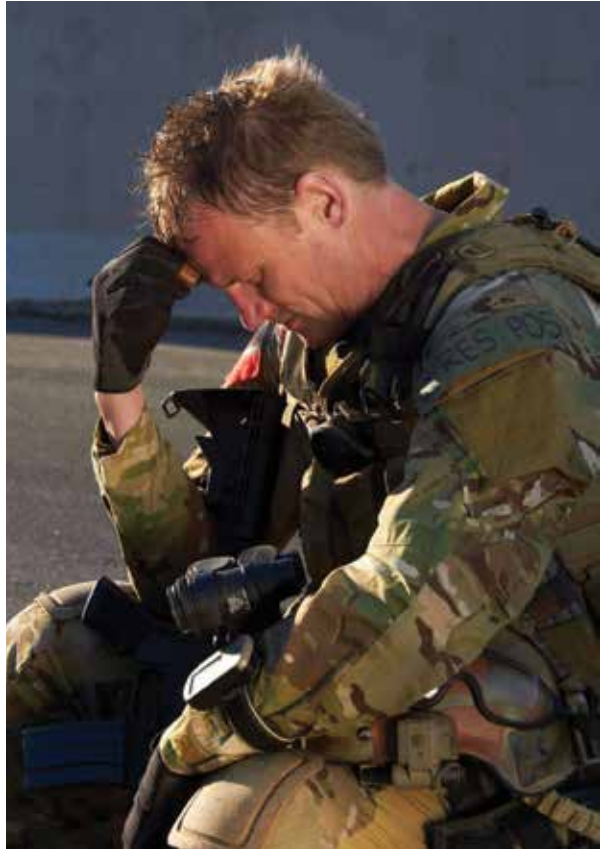
„Yra dalykų, kurie nuo tavęs nepriklauso ir nereikia dėl jų jaudintis. Tai eikvoja jėgas, kurias būtų galima panaudoti kitur. Tad geriausia dirbti tai, ką gali.“