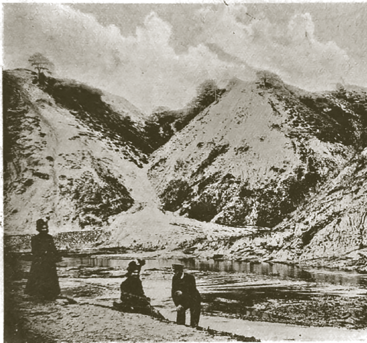
Montagne Bakiszowa — Vue prise de les jardins des Bernar

proteguojamai Bekešų giminei. Nuo 1579 m. Birštoną valdyti gavo minėtasis G. Bekešas.