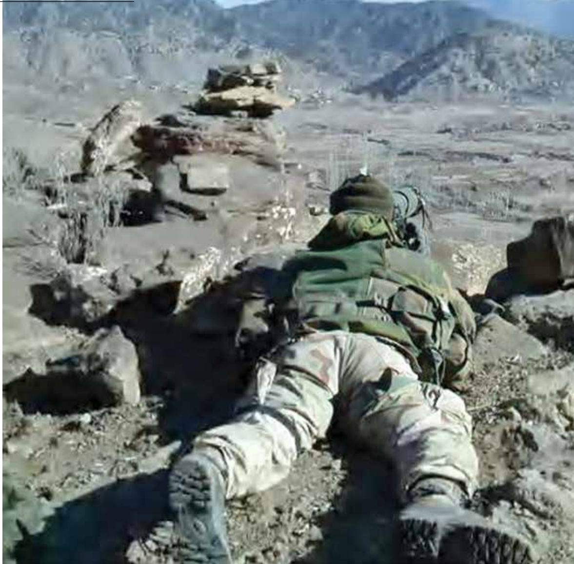
Stebėjimo punktas kalnuose. Afganistanas, 2002.

Iš namo išėjo šuns šeimininkas, veikiausiai piemuo. Senis su šautuvu. Tikriausiai jis buvo pasirengęs ginti savo turtą nuo vilkų ar vagių. Labai aiškiai matėme jį savo naktinio matymo okuliaruose, o jis mūsų – ne. Mus supo visiška tamsa, žinojau tai. Jei jis būtų galėjęs žvilgtelti mūsų akimis, būtų pamatęs tris infraraudonojo lazerio taškus ant savo krūtinės. Mes laukėme jo reakcijos.