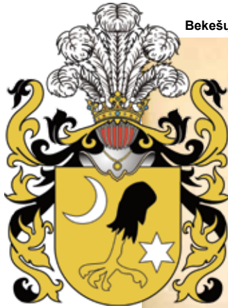
Bekešų giminės herbas

S. Batoras, tapęs ATR vadovu, stengėsi nepamiršti Tėvynei nusipelnusių asmenų, taip pat ir savo tautiečių. Manoma, kad jo valdymo metais į Lenkiją ir Lietuvą atvyko per 10 000 vengrų. Dauguma atvykusiųjų buvo kariškiai,