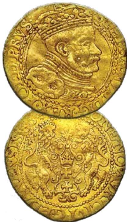
XVI a. auksinis dukatas su Stepono Batoro atvaizdu, nukaldintas 1586 m. Gdanske.