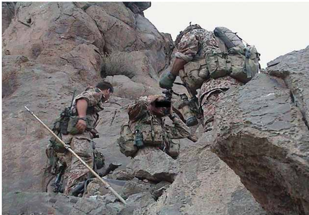
Žygis kalnuota vietoje – visada iššūkis.