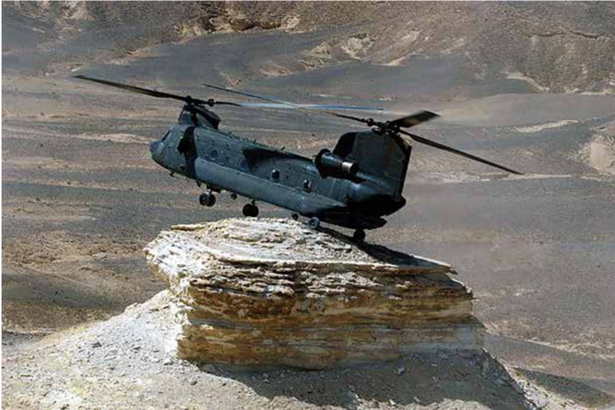
Specialiųjų pajėgų operatorius gabenantys pilotai – geriausi iš geriausių.

OK, galbūt pagrįsta judesių seka ir slepia nerivingumą bei jaudulį. Tai tam tikra ramybės terapija savo mintims. Aiškus struktūruotas mąstymas neleidžia užkimšti galvos nereikalingais dalykais. Svarbu užimti smegenis konkrečiomis mintimis apie konkrečius daiktus ir veiksmus, kuriuos jūs galite kontroliuoti. Tai padeda visada – šis mažas savęs patikrinimo procesas tikrai sumažina įtampą.