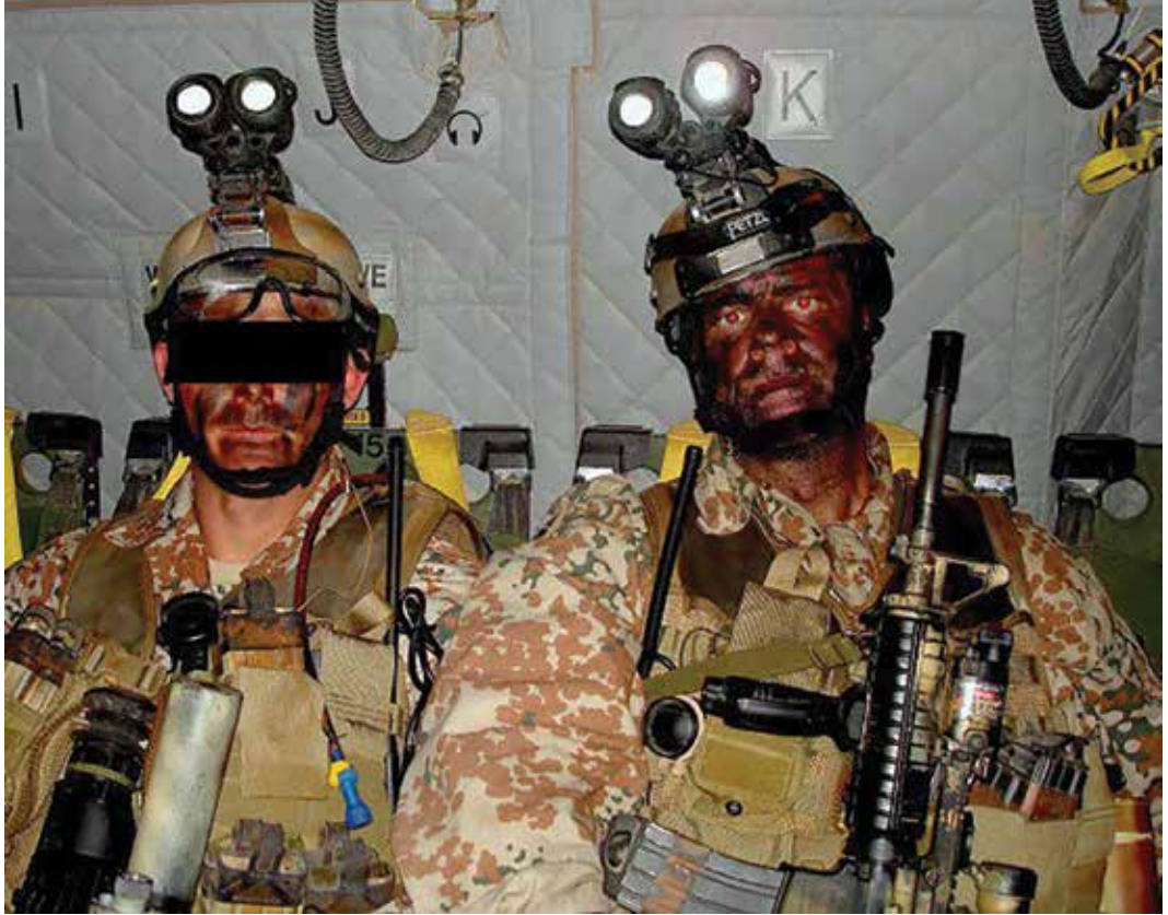
„Naktinio matymo prietaisas ant galvos – paruoštas. Tik reikia nuleisti jį prie akių“. Danų jėgeriai vyksta į užduotį.

galėčiau atidengti ugnį. Nors iš mano karabino nauda būtų menka. Činukas ir taip ginkluotas – 12,7 mm kulkosvaidis ant rampos ir du 7,62 mm gatlingai kiekvienoje pusėje.