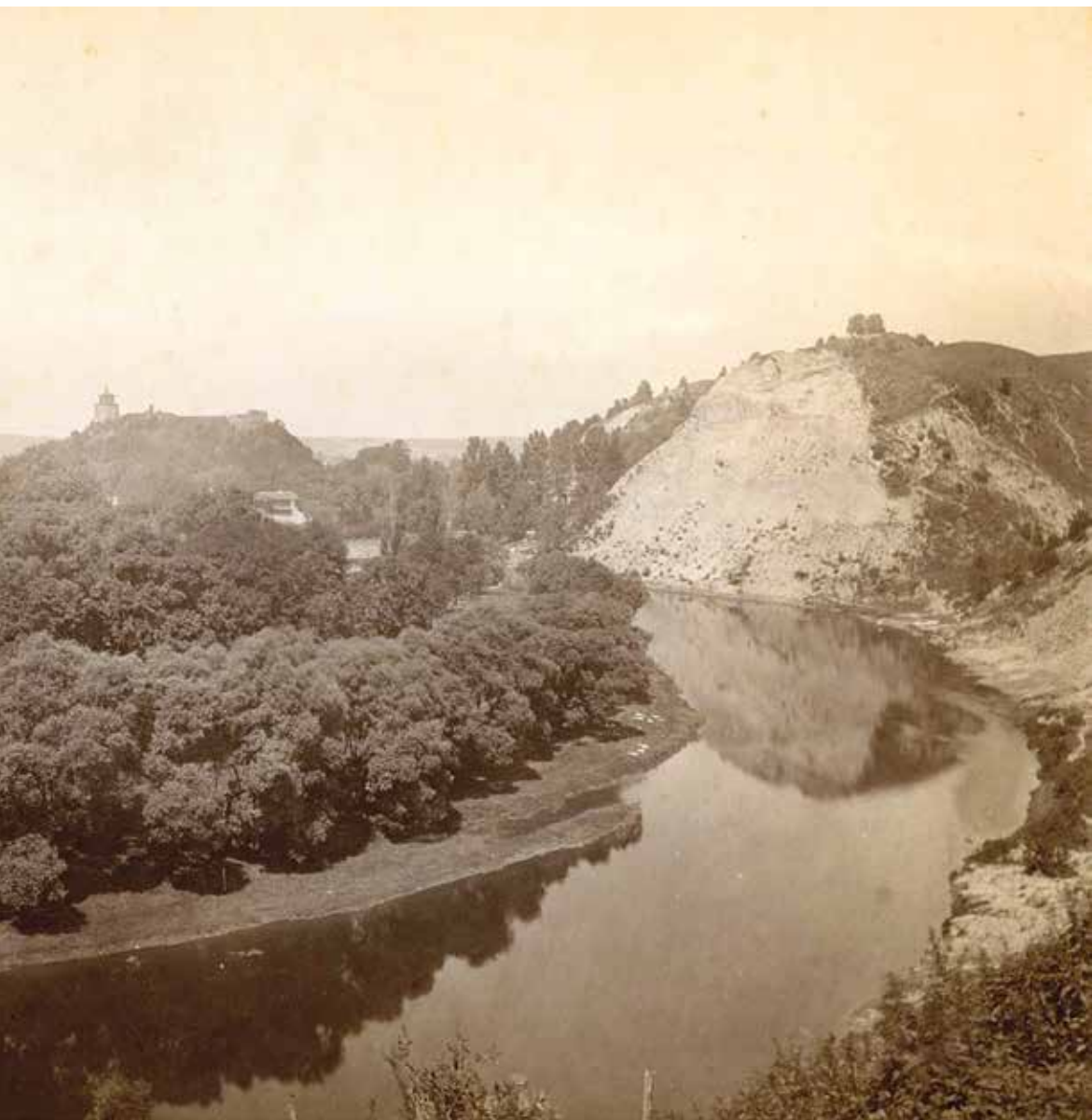
„Vilnios upė prie Sereikiškių parko. Dešinėje Bekešo kalno liekanos, toliau viduryje – Gedimino kalnas su bokštu.“ Józef Czechowicz fotografija, apie 1880 m.

56 grašiams, jo perkamoji galia buvo didelė. Pavyzdžiui, karo žirgas tuo metu kainavo apie 600, jautis – 120, statinė rugių – 12 grašių, o dalgį ar kirvį buvo galima nusipirkti už 6 grašius. Kiekvieną mėnesį 40 vengrų rotmistrų gaudavo po 20, 400 dešimtininkų po 5, 40 vėliavininkų po 5, o 3 520 karių po 4 vengriškus dukatus (auksinus). Iš viso per mėnesį jiems mokėta 18 977,