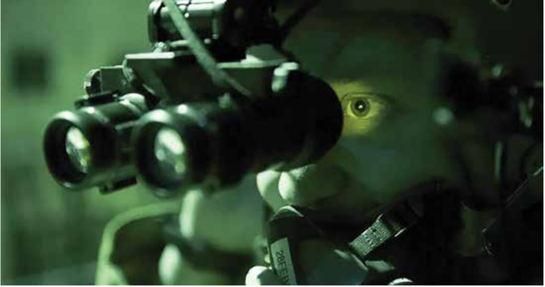
„Mes visiškai aiškiai matėm jį savo naktinio matymo okuliaruose, o jis mūsų – ne“.

Činukas pakilo ir nulėkė. Vėl tapo tylu. Staiga suvokiau, kad negaliu pakelti kuprinės. Prieš savaitę galėjau. Bet dabar trūko jėgų. Teko ignoruoti statutus, taktiką ir saugumą – nieko nepaisydami mes tiesiog atsistojomė šalia kuprinų ir iškart jas atidarėme. Vienoje gulėjo gertuvė, veikiausiai specialiai padėta. Vanduo buvo šiltas, bet tai neturėjo reikšmės. Gurkštelėjau ir pajutau, kaip vanduo skverbiasi į kiekvieną mano kūno ląstelę. Vaizduotėje pasivaideno lietaus sezonas Afrikoje. Nuostabus jausmas.